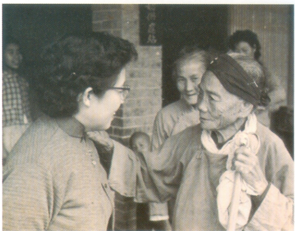
▲王國秀議員走訪民間，其親和力深受當地民眾愛戴。

抗戰勝利，緊接而來的是國共內戰，王議員於民國三十五年奉命赴東北保安司令部政治部，擔任同上校秘書職。其主要工作是協助蔣宋美齡女士推動婦女運動，成立婦女會，並率領婦女會赴各地勞軍。勞軍期間，王議員展現她口齒流利，辯才無礙的一面，給予將士們極大的精神鼓舞。然隨著戰局逆轉，南京軍事告急，民國三十七年冬，王議員隨軍撤退廣州，並搭乘軍船來臺。處於這樣一個動盪不安的國家，王議員自全面抗戰至國共內戰，嚐盡