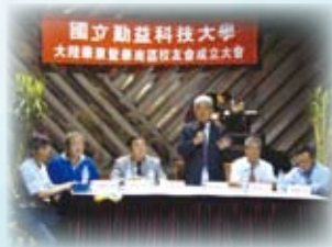
▲勤益大陸華東(南)地區校友會成立陳坤盛校長蒞臨致詞

2009年，本會陸續贊助勤益科技大學大陸廈門大學、山東棗莊學院、日本北見大學、以及新加坡南洋理工大學與新加坡理工學院之交流與參訪等。綜合以上交流活動，可看出本會對於國際文化交流之重視與其所展現之成效。