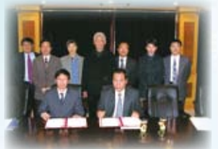
▲ 華東理工大學簽約留影